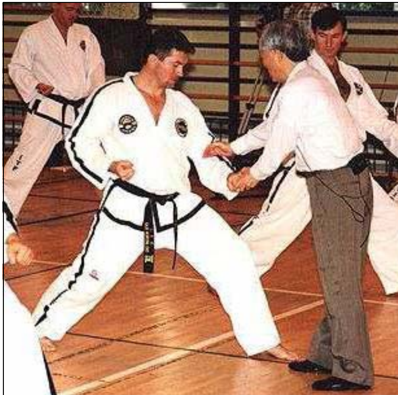
Gen. Choi Hong Hi var mycket noga med utförandet av alla tekniker.