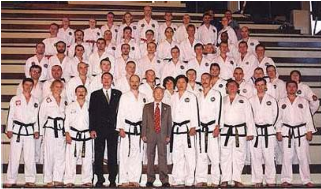
Seminariets deltagare tillsammans med Gen. Choi.