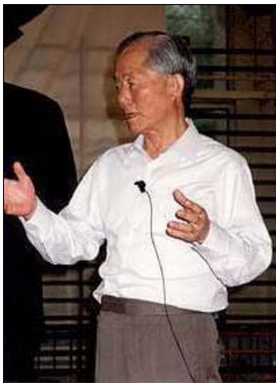
Gen. Choi Hong Hi undervisade trots sin höga ålder obehindrat 6 timmar om dagen under hela seminariet.