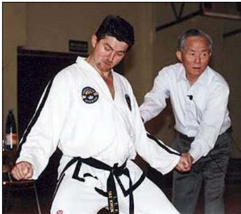
Swavek fick en fantastisk möjlighet att få hjälp med sina tekniker direkt från källan.