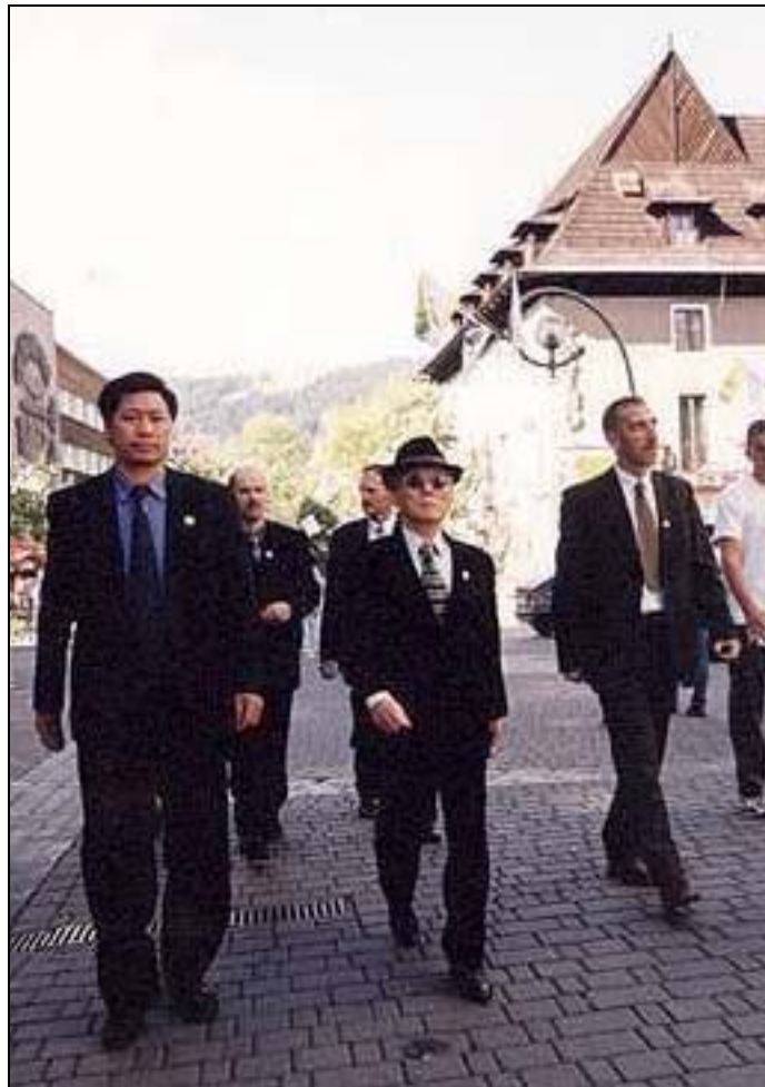
Gen. Choi under en promenad i turiststaden Zakopane.