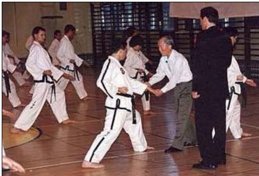
Även minsta detalj är viktig för att utföra en effektiv teknik.